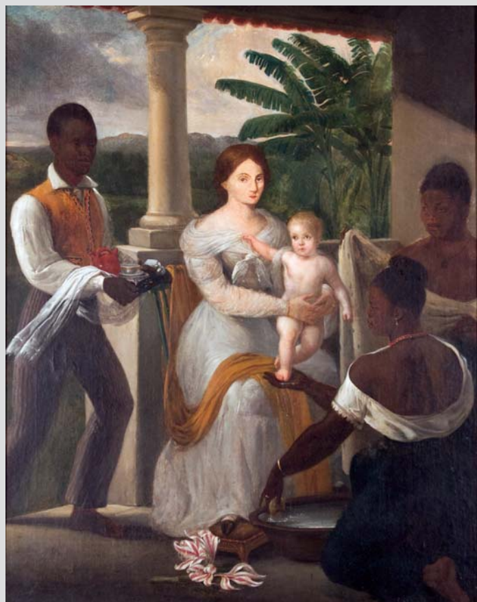
A. J. Pallière, O filho do artista tomando banho na varanda da residência de seu avô, 1830, 97 x 77cm