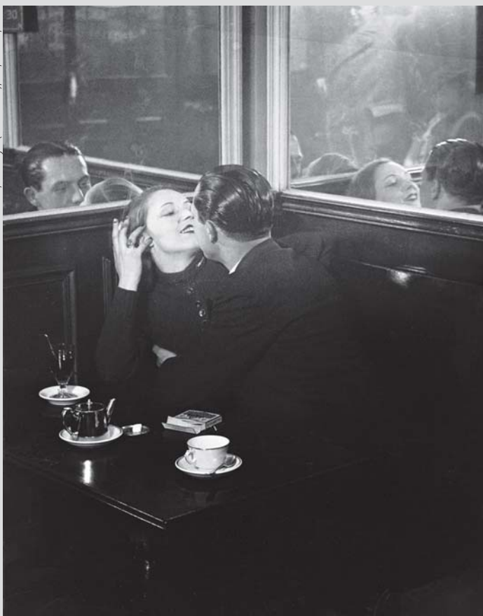
Brassaï, O beijo (Le baiser), 30,5 x 23,5cm

UNIVERSIDADE DE FORTALEZA ENSINANDO E APRENDENDO DESDE 1973