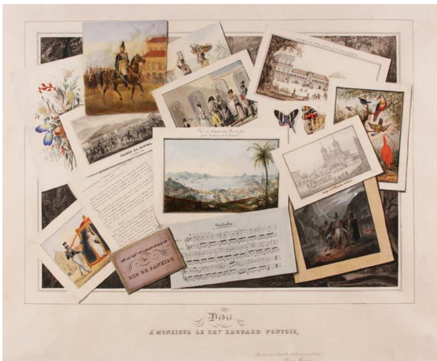
J. B. Debret, J. M. Rugendas, V. Barat e A. Porto Alegre, Souvenir de Rio de Janeiro, 1832, 60 x 73 cm

Entre os livros produzidos por autores cearenses, além dos já citados, encontram-se grande parte de edições de José de Alencar: Iracema (1870), Guerra dos Mascates (1871), tomos I e II de O Guarany (1857), volumes I, II e III de As Minas de Prata (1862), O Tronco do Ipê (1871), volumes I e II de Guerra dos Mascates (1871 e 1873), volumes I e II de Til (1872), volumes I e II de Alfarábios , O Garatuja , volume III de O Ermitão da Glória , Alma do Lázaro (1874) e O Sertanejo (1875).