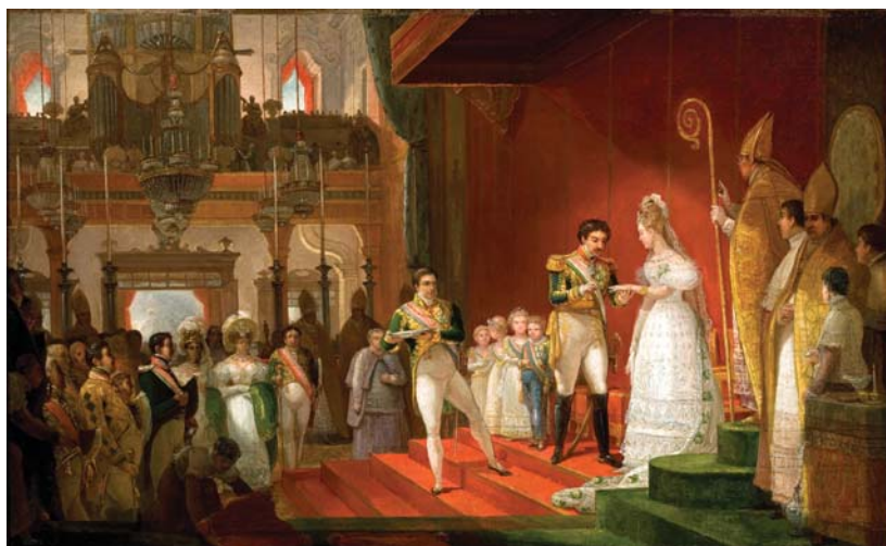
J. B. Debret, Casamento de D. Pedro I e D. Amélia, 1829, 45 x 72,3 cm