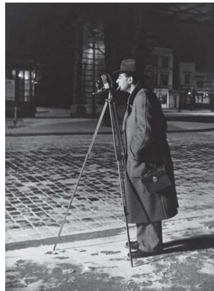
Acima: Brassai, Os garotos maus (Les mauvais garçons), 30 x 22cm; Brassai, Torre Eiffel (Tour Eiffel), 30 x 23,5cm; Brassai, Autorretrato (Autoportrait), 30 x 23cm