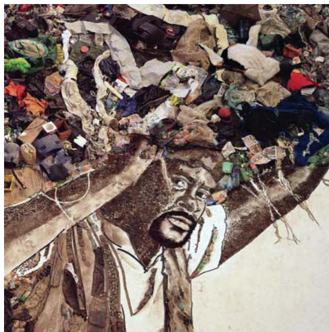
Atiba (Caribó), IMAGENS DE LIXO, 2006, digital C-print

Atualmente em acervos dos principais museus do mundo, Vik Muniz foi descoberto nos anos 90 pelo crítico de arte do The New York Times, Charles Haggan. Em 2001, foi o representante do Brasil na Bienal de Veneza. Em 2005, lançou o livro Reflex: A Vik Muniz Primer . Recentemente, foi convidado para ser o primeiro brasileiro a participar como curador na nona versão do Artist's Choice (2008–2009), projeto do Museu de Arte Moderna de Nova York.