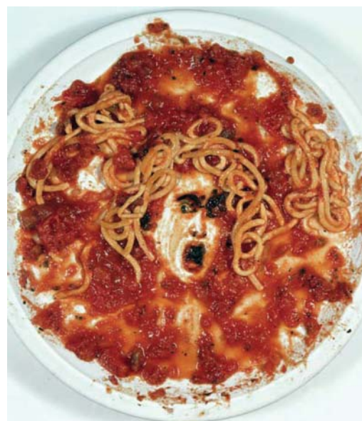
Medusa Marinara, 1998, diachrome print > 83,8 cm (diâmetro)