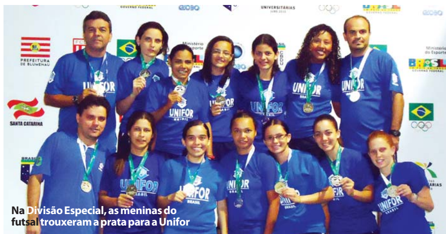
Na Divisão Especial, as meninas do futsal trouxeram a prata para a Unifor

Uma campanha que garantiu ouro, prata e bronze nos Jogos Universitários 2010. Os atletas da Unifor marcaram presença na competição realizada em Blumenau (SC), de 5 a 14 de novembro, trazendo excelentes resultados. Além dessas modalidades, a Universidade contou com representantes no vôlei feminino (4º lugar), basquete masculino (5º lugar), natação, atletismo e xadrez. Cerca de 90 atletas formaram a delegação, composta ainda de treinadores, professores, fisioterapeuta, profissionais do administrativo da Di-