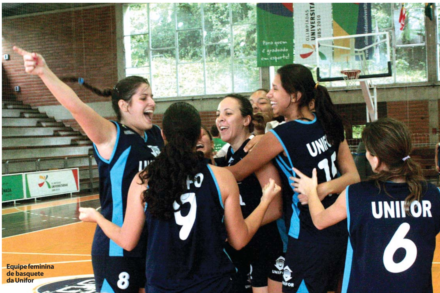
Equipe feminina de basquete da Unifor