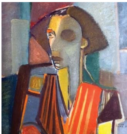
Figura Cadilha (pianista Berent), 1942 óleo sobre tela - 65 x 53,5 cm - Col. Sítio Burle Marx

a diversidade dos trabalhos do artista, como a montagem de uma sala original.