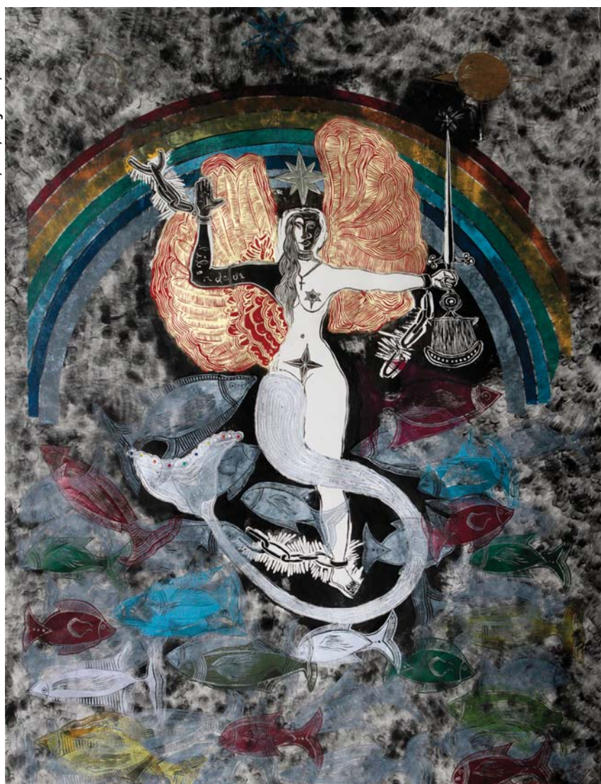
Sereia das Asas Vermelhas, 2010, xilogravura, 150 x 112 cm