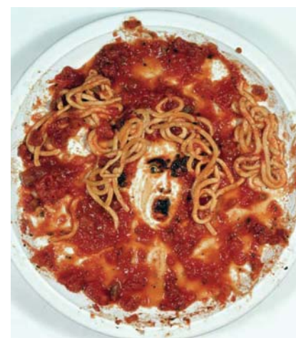
Medusa Marinara, 1998, dibachrome print > 83,8 cm (diâmetro)

A exposição revela o imaginário fascinante de Francisco de Almeida, um legítimo representante da geração 90 no Ceará. Entre as obras expostas, "Os quatro elementos", uma obra com 20 metros de comprimento para a qual o artista dedicou mais de nove meses de trabalho. Aberta até 1º de agosto, no Espaço Cultural Unifor, de terça a sexta, das 10h às 20h, e sábados e domingos, das 10h às 18h. Informações e visitas guiadas: 3477 3319.