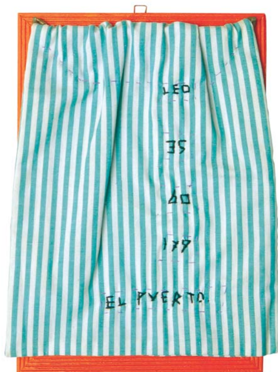
El Puerto. 1992. Bordado sobre tecido de algodão e espelho emoldurado. 23 x 16 cm

• De 11/02 a 15/03, de terça a sexta-feira, das 10h às 20h; e sábados e domingos, das 10h às 18h, no Espaço Cultural Unifor Anexo Aberto ao público