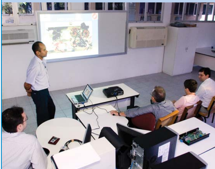
Apresentação técnica do projeto e formalização de sua entrega para a empresa que o fabricará para o mercado

Com vantagens para o mercado, a fonte tem proteção de sobrecarga, curto-circuito e temperatura excessiva, pode ser ligada em 110 ou 220 volts, automaticamente, sem necessidade de transformador, e pesa oito quilos.