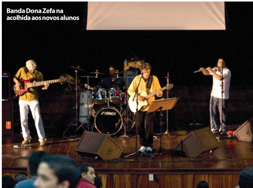
Banda Dona Zefa na acolhida aos novos alunos

Os interessados em participar do torneio, cujos jogos, cerca de 250, acontecem no período de 19 a 29 de março, podem efetuar sua inscrição por meio da Federação Cearense de Tênis, pelos telefones 8830 2960 e 8841 8891 (professor Anfrísio Nóbrega) ou procurar a DAD, localizada no Ginásio Poliesportivo. Telefone da DAD: 3477 3143.