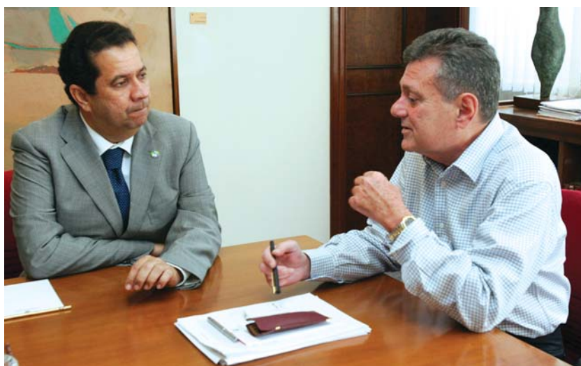
Ministro é recebido pelo chanceler Airton Queiroz

O ministro esteve em Fortaleza também para o lançamento do Plano Setorial de Qualificação (Planseq) do Microcrédito. O programa - o primeiro nesta modalidade - vai qualificar 3.400 empreendedores de atividades de pequeno porte em 17 estados brasileiros e beneficiar, indiretamente, outras 10 mil pessoas.