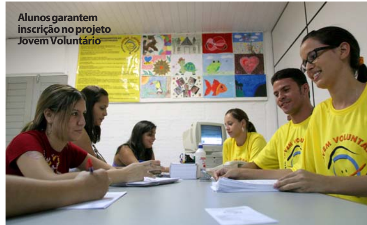
Alunos garantem inscrição no projeto Jovem Voluntário

No curso de Direito, para quem tiver 60 créditos cursados até 2006.2, há vagas para 13 dos 31 programas do Projeto Cidadania Ativa. O projeto atua em bairros de Fortaleza, como Dendê, Luciano Cavalcante, Messejana, dentre outros. A sistemática do Cidadania Ativa consiste na realização de 'aulas-reuniões' semanais, nas quais são