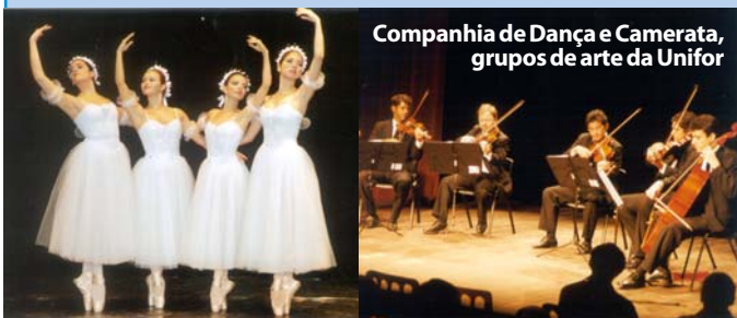
Companhia de Dança e Camerata, grupos de arte da Unifor

SERVIÇO: • Mais informações pelo telefone 3477 3311 - Divisão Sócio-Cultural