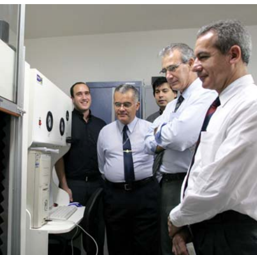
Militares do Ministério da Defesa e da Marinha em visita à Unifor