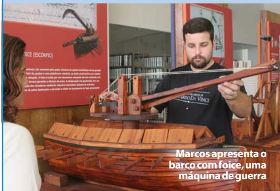
Marcos apresenta o barco com foice, uma máquina de guerra

• Exposição em cartaz até 19/11 no Centro de Convivência da Unifor - Visitação: diariamente, das 9h às 21h - Entrada gratuita - Inf.: (85) 3477 3311