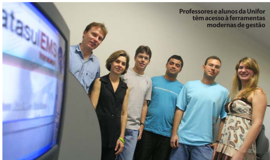
Professores e alunos da Unifor têm acesso às ferramentas modernas de gestão

A partir de 16 de novembro, a Unifor recebe inscrições para o Vestibular 2007.1. Confira o edital do processo seletivo e obtenha mais informações no site www.unifor.br ou pelos telefones (85) 3477 3249 - Comissão Permanente do Processo Seletivo (CPPS) e 3477 3400 - Call Center.